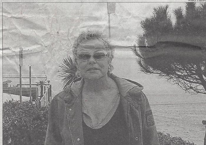
Muriel Robin, ici en janvier 2007, vient régulièrement à La Baule. Mais elle aussi a cédé à la « tentation corse » en achetant une maison sur l'île de Beauté.